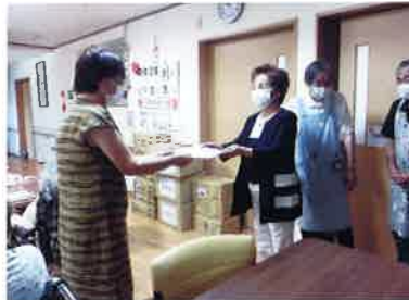
グループホーム「桜の園」

利用者に明るい気持ちになってもらおうと毎年、施設の要望に合わせて備品などを届けています。施設の方からは「タオルは非常に貴重で、おしりふきはすぐになくなってしまいうので大変ありがたい」と喜んでいただけました。