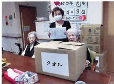
タオル・おしりふき寄贈