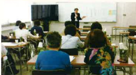
中田事務局長講話