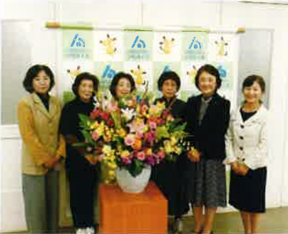
絵はがきコンクール表彰式受付