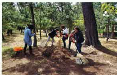
能美市 根上山落ち葉集め