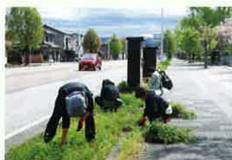
小松市 花壇の清掃

除草作業は、毎年春と秋の2回それぞれ小松市・加賀市・能美市の3か所に於いて実施しており、小松、加賀では、駅周辺の歩道や花壇の清掃作業を行い、能美市の根上山では、落ち葉をかき集めるなど地域の美化活動に汗を流しました