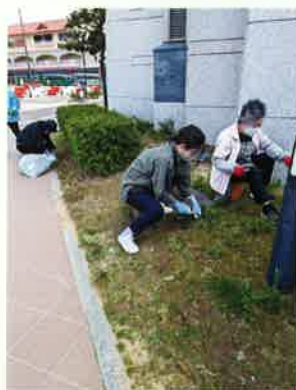
加賀市 美術館周辺の清掃