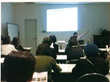
大阪企業家ミュージアム研修

中の創意工夫「他社とは違う優位性を生み出す目的達成のためのイノベーション」というところで、「日本で初めてお菓子におもちやを付けて売り出した会社」江崎グリコが取り上げられており、大阪の人にとってグリコはやはり特別な存在なのだと思いましたが、（道頓堀のグリコサインを思い出しながら）次に全国から大阪に集まった企業家達を紹介した展示エリアを係の方の解説を伺いながら見学し、現代にも残る企業の数と多彩さに流石大阪、企業家精神育む土壌あり、と感心しました。