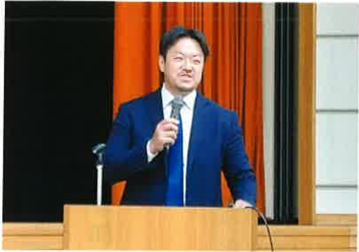
於：川北町文化センター