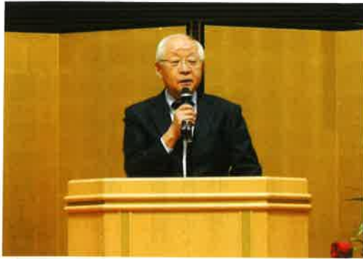
於：ホテルアローレ

地域社会への貢献事業として、小松法人会と各商工会議所・商工会との共催による講演会を各支部で実施しました。多数の方の聴講ありがとうございました。講演会の詳細は左記のとおりで、当日は、各会場において税に関する各種の小冊子等を希望者に無料で配付しました。