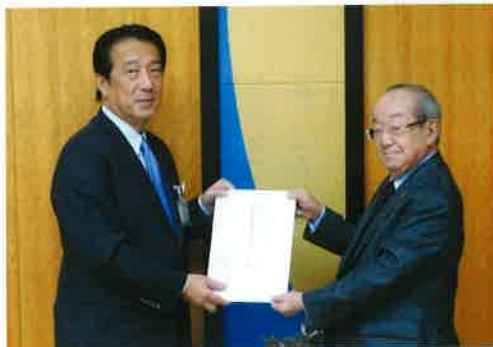
(能美市長への提言活動)