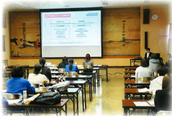
令和6年分 年末調整説明会 (小松商工会議所)

小松法人会では、税に関する研修会として、新設法人説明会（年2回）、決算期別説明会（年4回）を開催しているほか、税務研修会及び年末調整説明会を開催しております。皆様のご参加をお待ちしております。