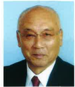
公益社団法人小松法人会 会長

結びに、会員の皆様方のますますのご健勝及び会員各社の事業のご発展並びにご家族のご健勝を心から祈念いたしますとともに、税務当局及び関係団体の変わらぬご指導を賜りますようお願い申し上げます、年頭のご挨拶とさせていただきます。