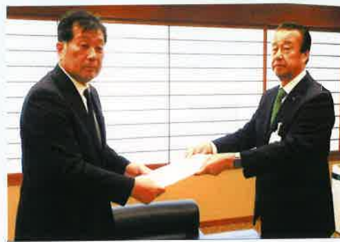
(加賀市長への提言活動)