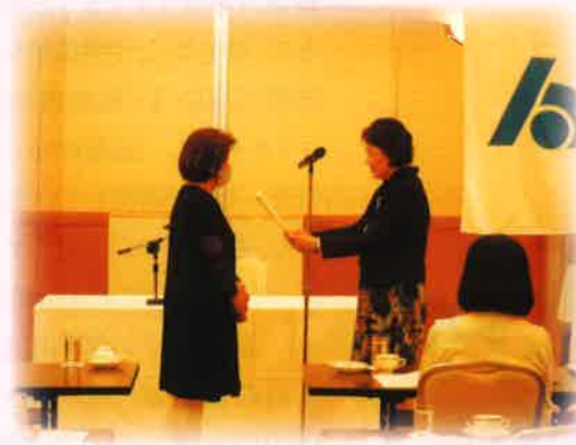
(於：ルートイングランティア小松エアポート)