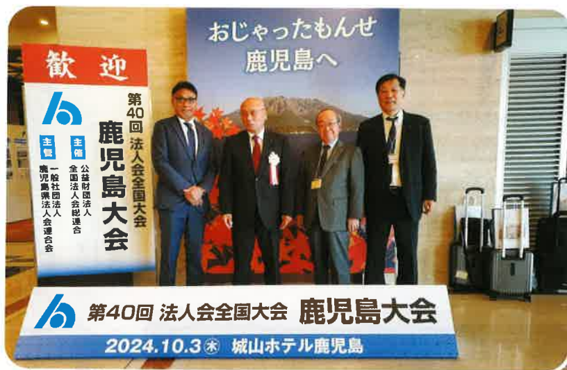
第40回 法人会全国大会 鹿児島大会 2024.10.3 城山ホテル鹿児島