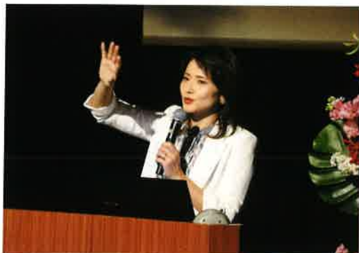
於：小松市民センター