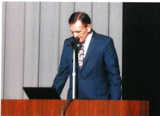
於：能美市辰口福祉会館