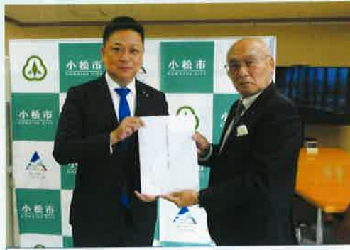
(小松市長への提言活動)