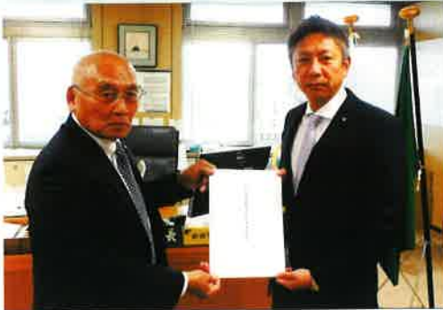
(小松市議会議長への提言活動)