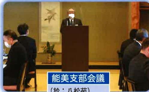
能美支部会議 (於：八松苑)