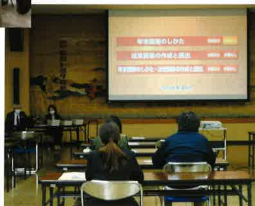
令和4年分 年末調整説明会 (小松商工会議所)