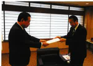
(加賀市長への提言活動)