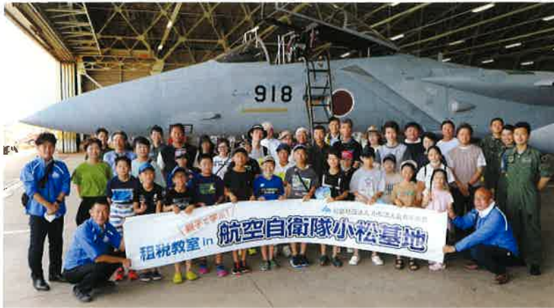
「親子で学ぶ!租税教室 in 航空自衛隊小松基地」の開催

小松法人会(青年部会、女性部会)では、次代を担う子供たちに租税の意義や役割を正しく学んでもらうための租税教育活動を活動の大きな柱と位置付けており、本年度も小学六年生を対象に租税教室を開催しました。