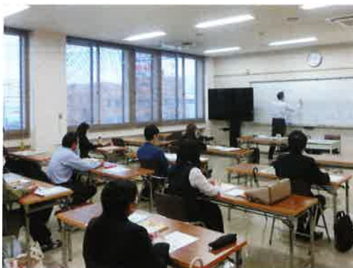
税務研修会 (小松商工会議所)