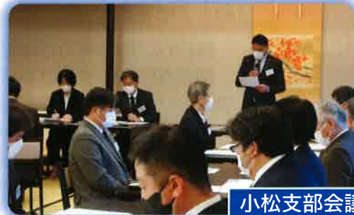
小松支部会議 (於：小六庵)