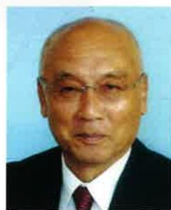
公益社団法人小松法人会 会長

結びに、会員の皆様方のますますのご健勝及び会員各社の事業のご発展並びにご家族のご健勝を心から祈念いたしますとともに、税務当局及び関係団体の変わらぬご指導を賜りますようお願い申し上げます。年頭のご挨拶とさせていただきます。