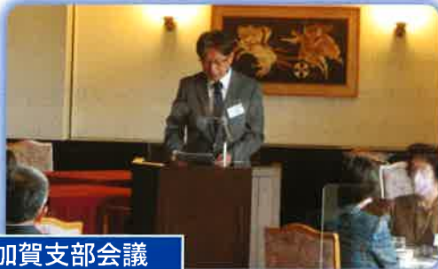
加賀支部会議 (於：ホテル・アローレ)