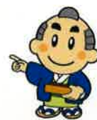
県税キャラクター 直之くん