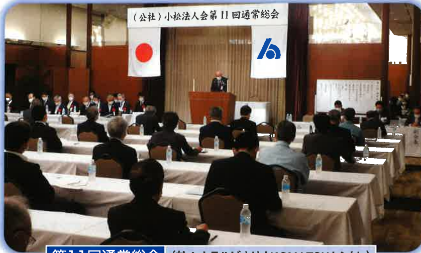
第11回通常総会 (於：ホテルピナリオKOMATSUセントレ)