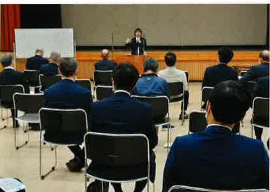
於：川北町文化センター