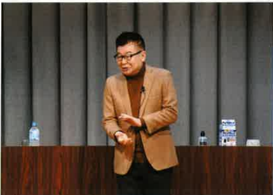
於：能美市辰口福祉会館