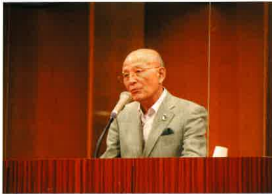
於：こまつ芸術劇場うらら