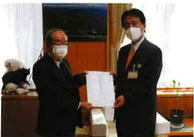
(能美市長への提言活動)